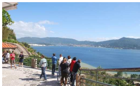
コンセイソンミス海 展望台, Florianópolis, SC