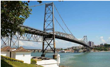
ヘルシリオ ルス ブリッジ, Florianópolis, SC

含まれないもの：空港税 (R$61,10)、日程に記載されていない観光と食事、飲類、電話、ランドリー、ミニバー、チップ等、個人に関わる経費。