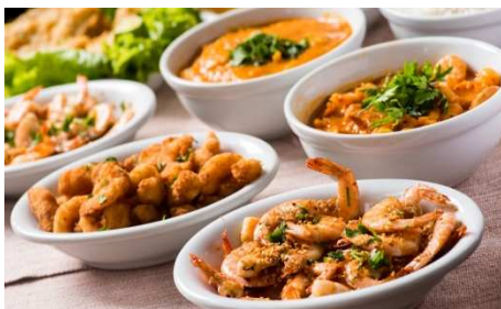
海老料理, Florianópolis, SC