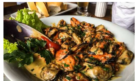
カラス貝料理, Porto Belo, SC