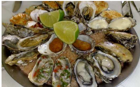
牡蠣料理, Florianópolis, SC