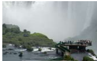
Cataratas do Iguaçu