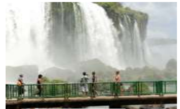
Cataratas do Iguaçu