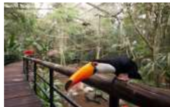
Parque das Aves