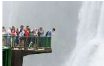
Cataratas do Iguaçu