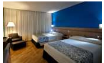
Hotel Viale Cataratas