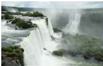
Cataratas do Iguaçu

注意事項：パック料金は2017年3月現在であり、現地事情・航空会社事情により、予告なしに変更となる場合がございます。