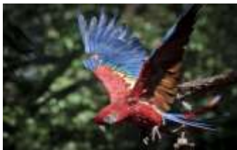
Parque das Aves