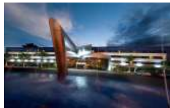
Hotel Viale Cataratas