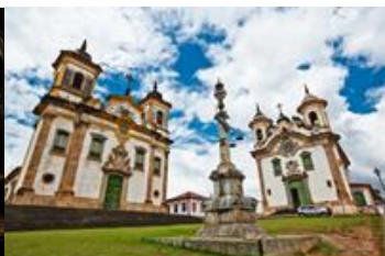
Igreja de São Francisco de Assis