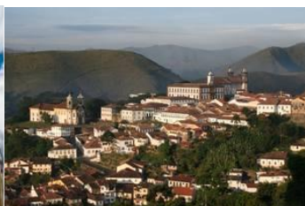
Cidade de Ouro Preto