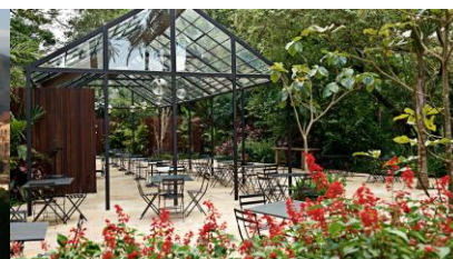
Parque de Inhotim

Recomendamos levar: Roupas e calçados confortáveis, calça comprida (para alguns passeios), sapato fechado, chapéus repelente, protetor solar, Baterias e cartões de memória sobressalentes (câmeras/filmadora), Remédios de uso contínuo, Pequena bolsa ou mochila. LEVAR DINHEIRO EM ESPÉCIE, POIS ALGUNS ESTABELECIMENTOS DA REGIÃO NÃO TRABALHAM COM CARTÃO.