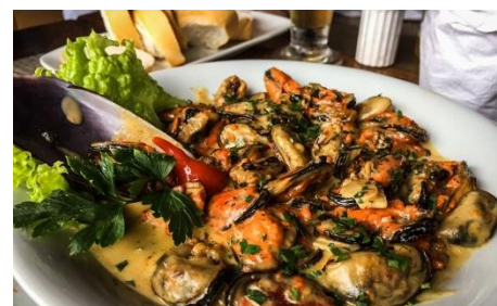
PRATO DE MARISCO, Porto Belo, SC