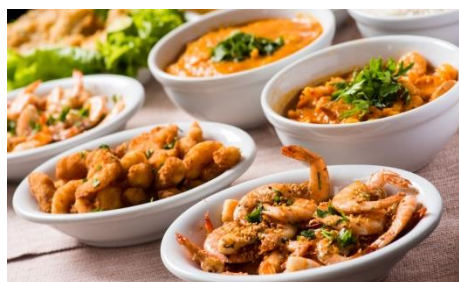
SEQUENCIA DE CAMARÃO, Florianópolis, SC