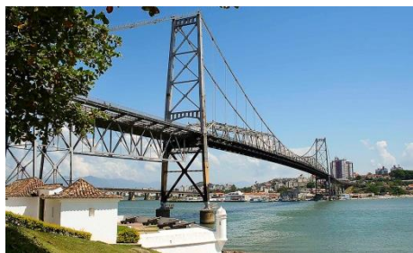
PONTE HERCÍLIO LUZ, Florianópolis, SC

Não inclusos: Taxa de embarque (R$61,10), Passeios e refeições não descritos no roteiro ou informado como "não incluso" ou "Valor à parte". Bebidas em geral (inclusive das refeições), Telefonema, Lavanderia, Gorjetas e todas as despesas de caráter pessoal.