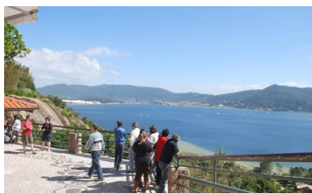
MIRANTE DA LAGOA, Florianópolis, SC