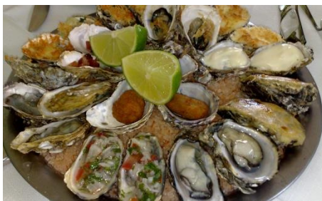
SEQUENCIA DE OSTRAS, Florianópolis, SC